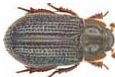
Glanz-Knochenkäfer ( Trox perrisii )

Neben trox perrisii fanden die Käferkundler auch den seltenen Kurzschrüter ( Aesalus scarabaeoides ), den Plattrüßler ( Gasterocercus depressirostris ) sowie als Neunachweis für Thüringen Reitter's Strunksaftkäfer ( Synchita separanda ).