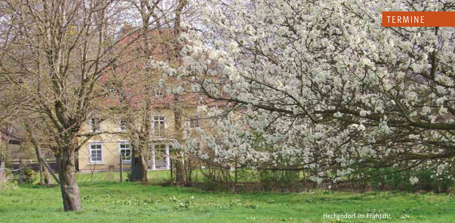
Hechendorf im Frühjahr.