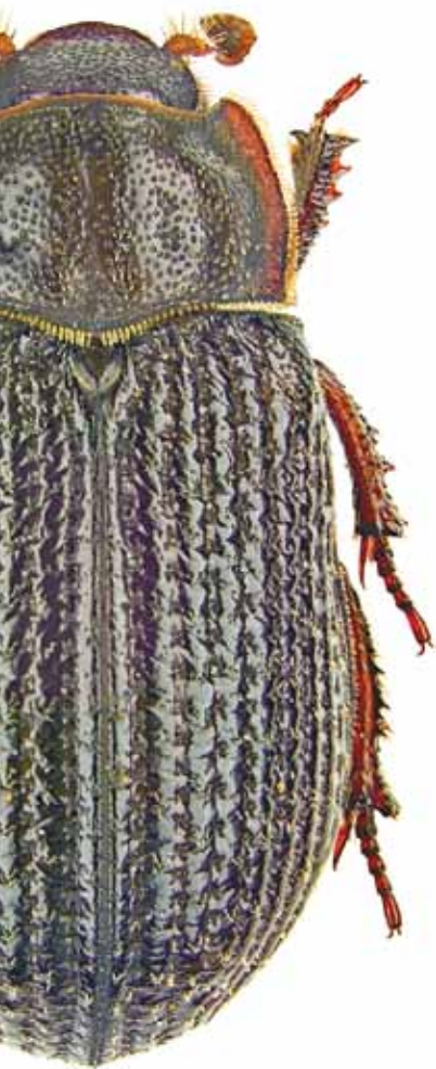
Trox perrisii ist einer von mindestens vier Urwaldreliktarten, die von Käferforschern in der hohen Schrecke nachgewiesen worden.

Ja. Und Trox perrisii , zu deutsch Glanz-Knochenkäfer, ist so ein Feinschmecker, so ein Nahrungsspezialist, der braucht den Mulm, der sich in solchen Höhlen bildet. Trox perrisii lebt von totem Getier, von Knochen oder von Federn, die sich auch erst einmal in Spechthöhlen ansammeln müssen, da muss die Buche dann also schon 200 Jahre alt sein. Um als Art überleben zu können, muss dieser Käfer spezielle Lebensumstände an sehr alten Bäumen finden, die nicht weit voneinander entfernt stehen. Denn er